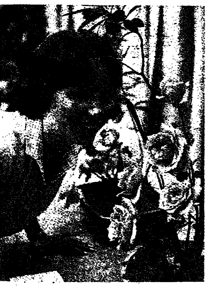
الانكليز يحبون الورد

في مؤسسة خيرية لا تهدف الى الربح ، وما قد تحصل عليه من ربع مادي تقدره سنويا الى المحتجين والجمعيات الخيرية ، فالوردة بالنسبة ليها هي الامم .